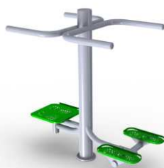
2w1 Wahadło + stepper