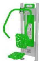
Wyciskanie siedząc ODF/01-11