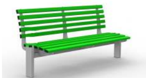
Ławka LUX metalowa