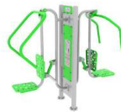
Wyciskanie siedząc + podciąg + pylon