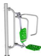
Wyciskanie siedząc ODF/02-11