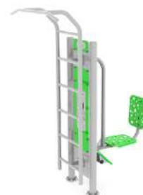
Drabinka + prasa nożna + pylon