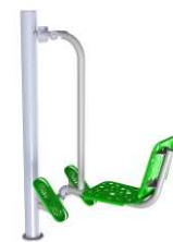
Prasa nożna ODF/02-04