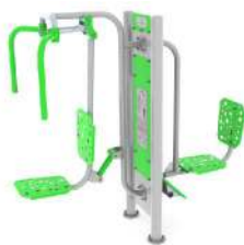
Motyl + prasa nożna + pylon