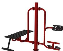
Ławeczka + prostownik pleców + słup nośny