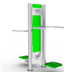
Twister + wahadło + pylon