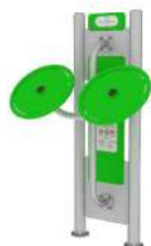
Koła małe ODF/01-02