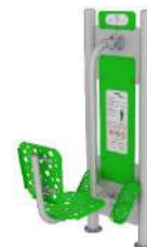
Prasa nożna ODF/01-04