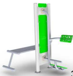
Ławeczka + prostownik pleców + pylon