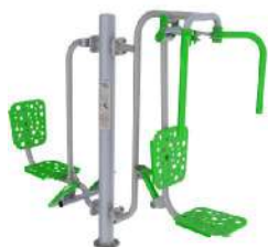
Prasa nożna + motyl + słup nośny