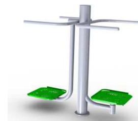
2w1 Wahadło + twister