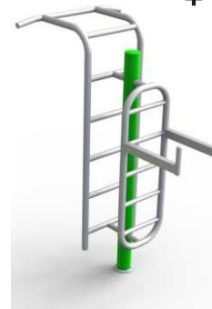
Drabinka + podciąg nóg + słup nośny