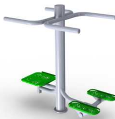
2w1 Twister + stepper