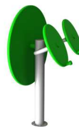
Koło duże + małe + słup nośny