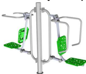
Podciąg + wyciskanie siedząc + słup nośny