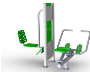
Prasa nożna + wiosło + pylon