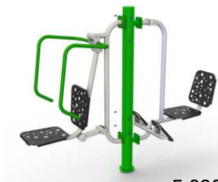
Wyciskanie siedząc + prasa nożna + słup nośny