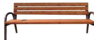
Ławka parkowa metalowa z siedziskiem drewnianym