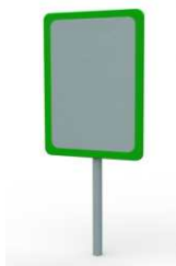
Tablica STANDARD informacyjna z regulaminem