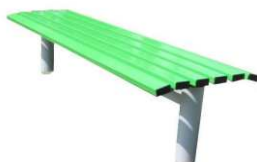
Ławka sportowa metalowa