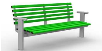
Ławka LUX metalowa